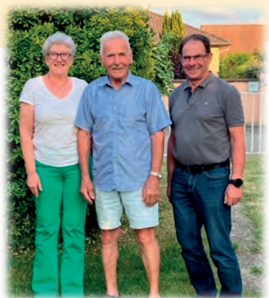
Nous remercions M. Riber pour les décorations de Noël qu'il a réalisé toutes ces années pour le village