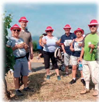
Les Foulées de la Ligue à Colmar en juin

VENEZ NOUS REJOINDRE SI LE COEUR VOUS EN DIT.