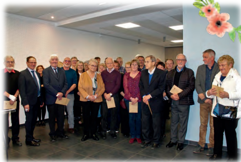
Lauréats 2022 récompensés en janvier 2023