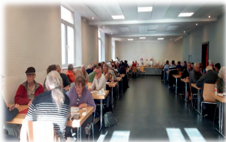
Le tournoi de belote en octobre